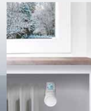
Facilità di lettura anche in spazi angusti e poco illuminati